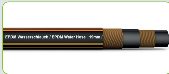
Gummi Wasserschlauch aus EPDM