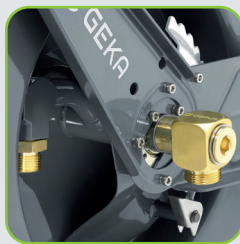
GEKA® plus Armatur und Rohr mit vollem 3/4" Wasserdurchfluss