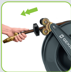
Arretierung durch Zug am Ende des Schlauchs steuerbar