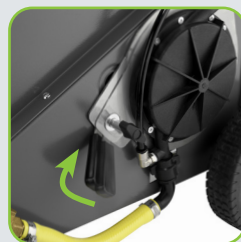
Interrupteur de marche à vide pour une extraction facile du tuyau