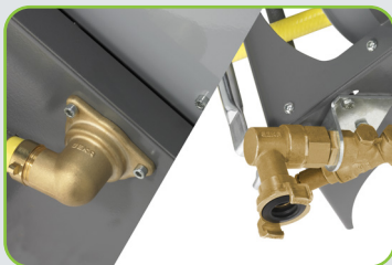
Garnitures GEKA® plus en laiton de qualité supérieure