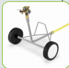
Dévidoir avec arroseur