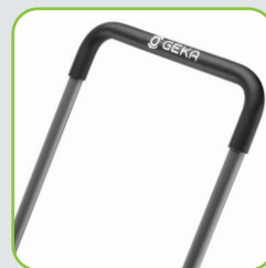
Hauteur de guidon agréable et avec soft grip