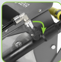
Débit d'eau réglable