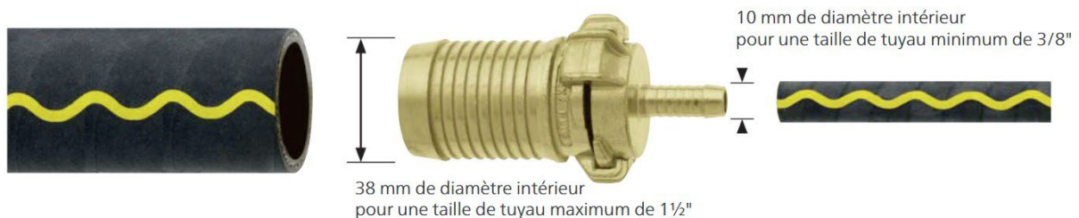
Image 2 : les tuyaux de 3/8" à 1 1/2" peuvent être raccordés entre eux

De plus, les raccords GEKA permettent de raccorder entre eux des tuyaux de différentes tailles. Cela va des tuyaux de 3/8" avec un diamètre intérieur de 10 mm aux tuyaux de 1 1/2" avec un diamètre intérieur de 38 mm. Tous les tuyaux d'arrosage courants entrent dans cette plage de diamètres.