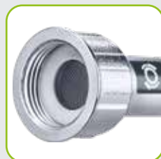
Eingelegter Schmutzfilter verhindert Ablagerungen