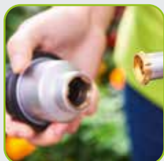
Bajonett-Anschluss für bequemen Gießkopfwechsel per Klick