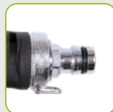
GEKA® plus Steckanschluss