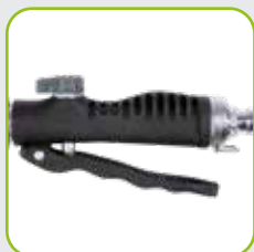
Hebelventil ideal zum Impulsgießen