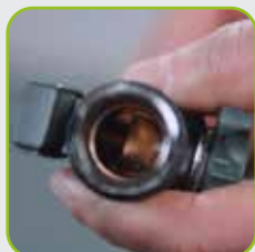
Robust durch Metallkorpus