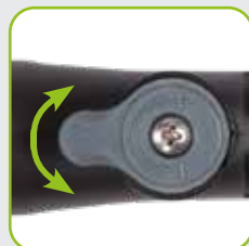
Individuelle und stufenlose Einstellung der Wassermenge