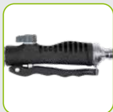
Fixierbügel zur Arretierung des Hebels