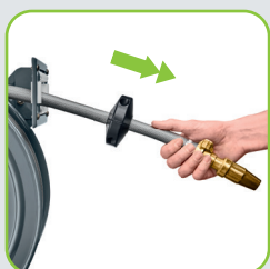
Blocage réglable en tirant le tuyau par le bout