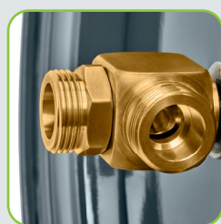
Raccord rotatif GEKA® plus 90° avec passage entier de l'eau de 3/4"