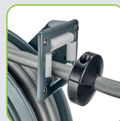
Guidage de tuyau doux