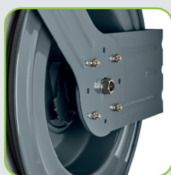
Construction robuste en acier